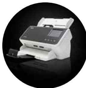
Skanery Alaris S2060w/S2080w