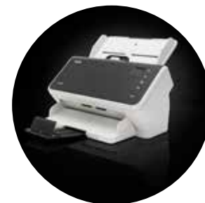
Skanery Alaris S2050/S2070